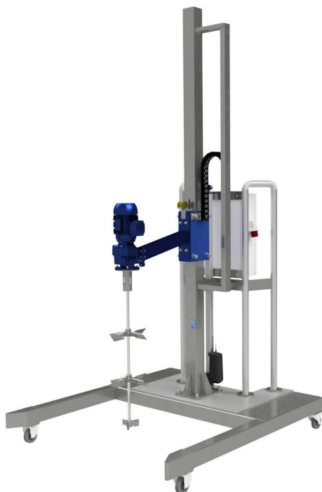
Station de mélange mobile