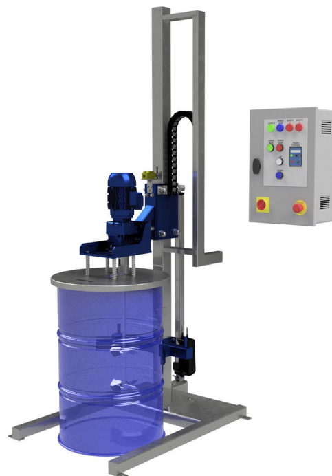
Station de mélange pour fût